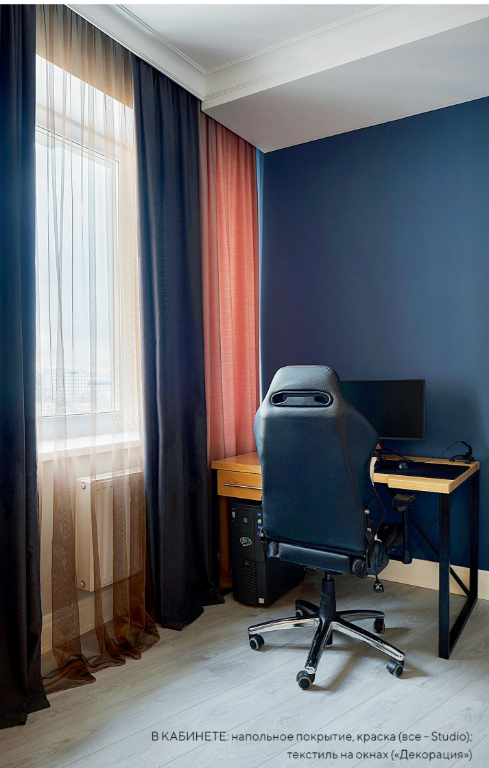
В КАБИНЕТЕ: напольное покрытие, краска (все - Studio); текстиль на окнах («Декорация»)