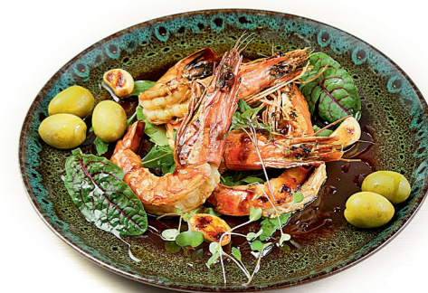
Тигровые креветки в устричном соусе

ул. Эрвье, 32, корпус 1. (3452) 38-38-00