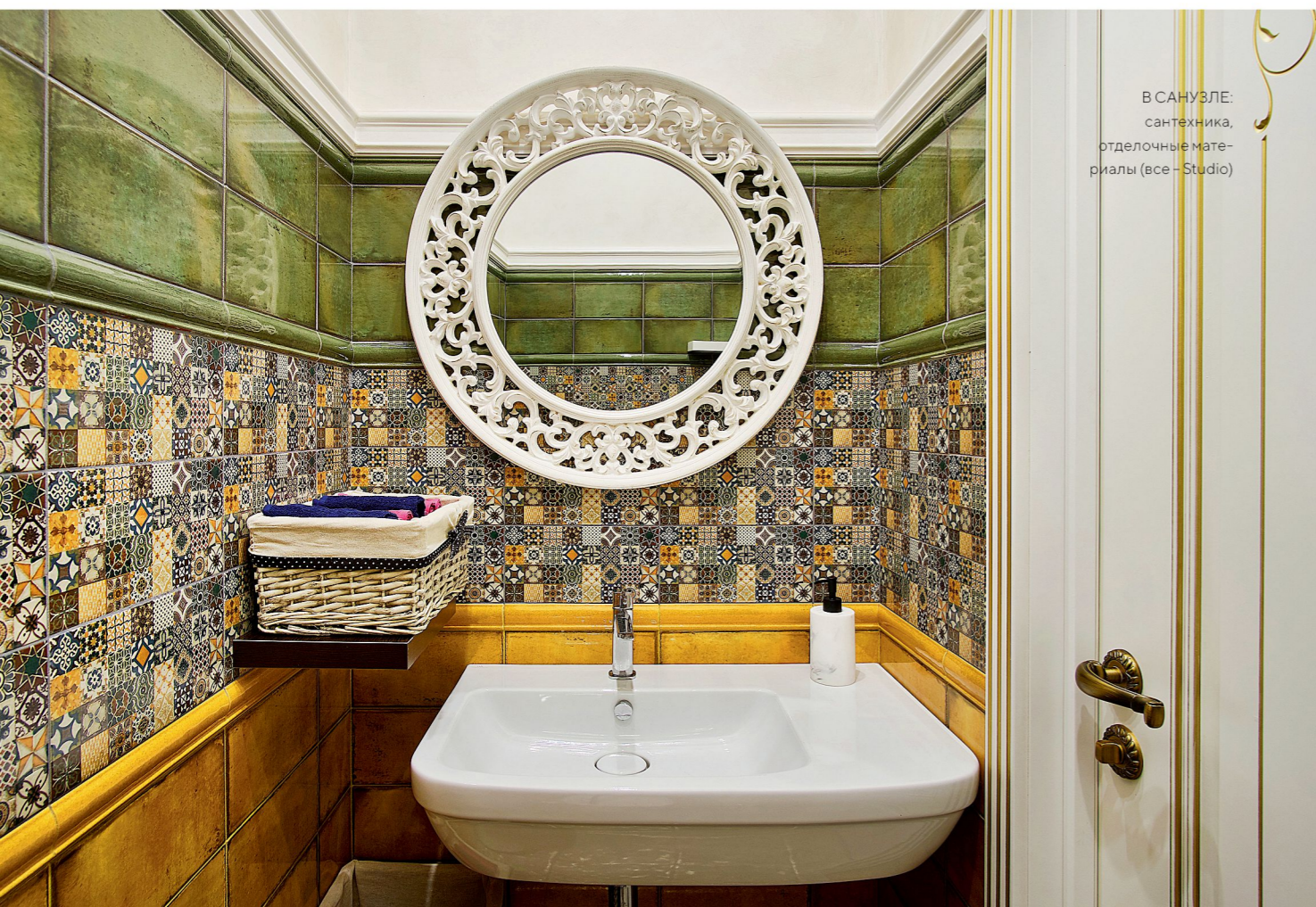
В САНУЗЛЕ: сантехника, отделочные мате- риалы (все – Studio)