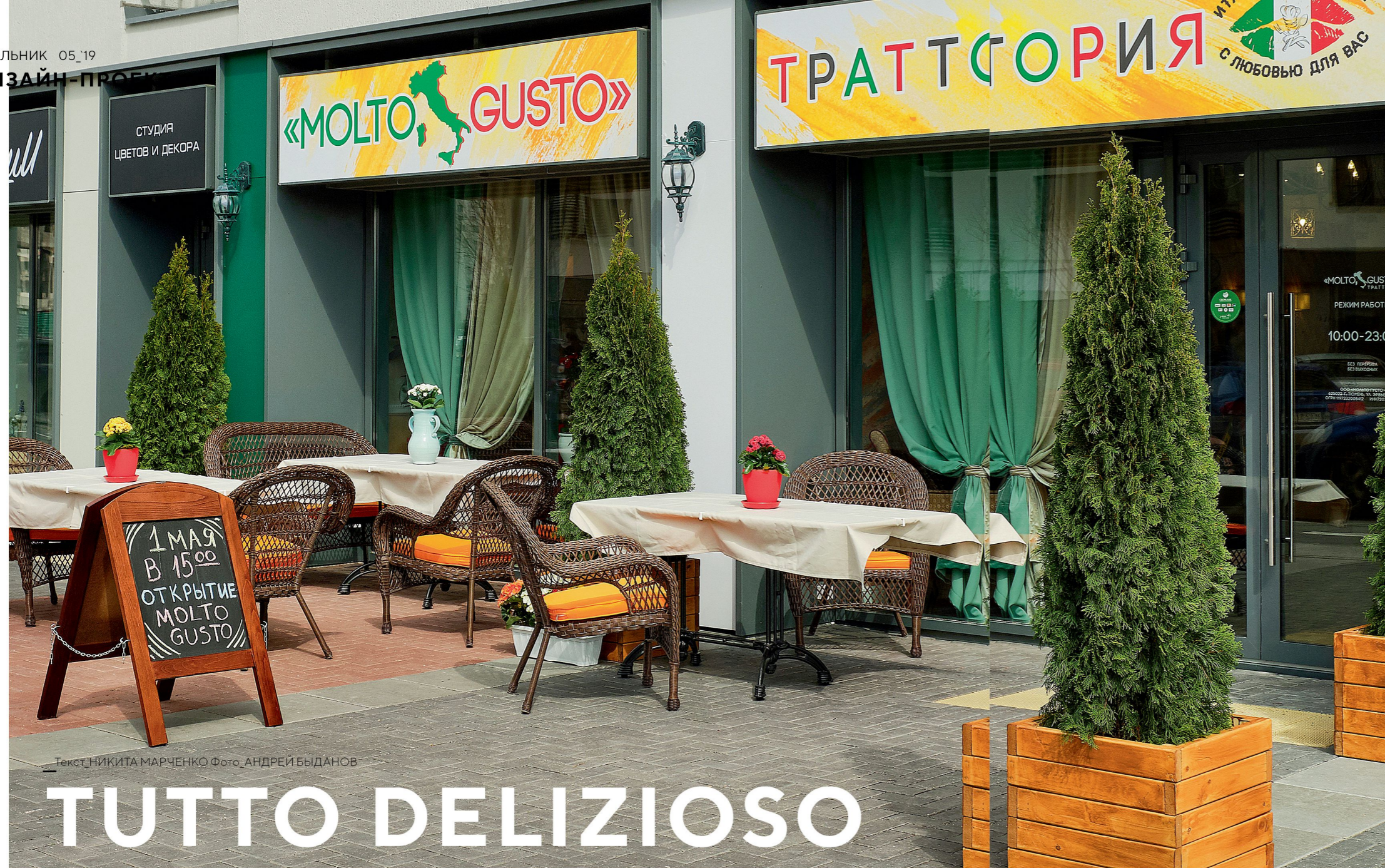
Текст НИКИТА МАРЧЕНКО