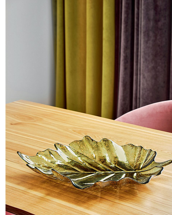
Блюдо, «Кленовый лист», UMA (Maiolica)

КУХНЯ: стулья (все – Allegro); блюдо, «Кленовый лист», скульптура, «Лошадь», все – UMA (Maiolica); напольное покрытие, обои, краска (все – Studio); скрытые двери («Волховец»)