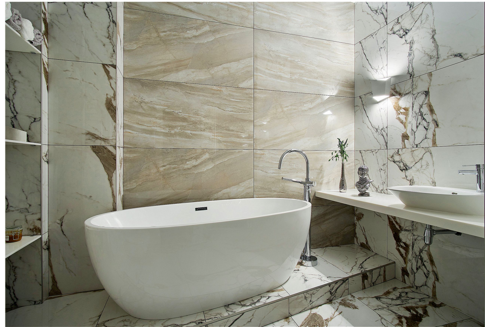
В САУЗЛЕ: скульптура, «Африка», ваза «Серебро» (все – UMA, Maiolica); испанский керамогранит, краска (все – Studio)

В СПАЛЬНЕ: прикроватные столики, кровать, матрас, подушки, постельное белье, покрывало (все – Allegro); напольное покрытие, обои, краска (все – Studio); текстиль на окнах («Декорация»)