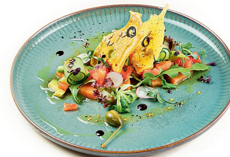
Салат с лососем домашнего копчения в кисло-сладком соусе

Совершите гастрономическое путешествие по Италии, не покидая города. Ведь кухня trattorie Molto Gusto вобрала в себя лучшие вкусы разных регионов – от фешенебельного Милана до вечно солнечной Сицилии.