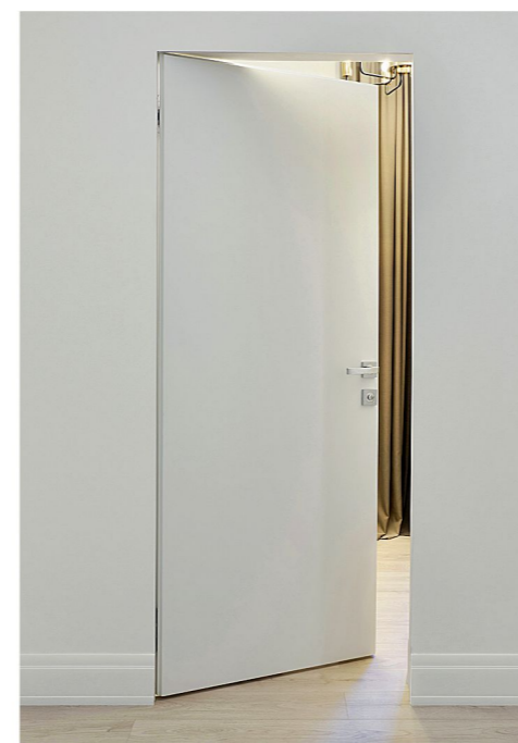
Скрытые двери («Волховец»)

В СТУДИИ РУЧНЫХ ПОДАРКОВ MAIOLICA БЫЛИ ПОДОБРАНЫ ИНТЕРЬЕРНЫЕ ИЗДЕЛИЯ РУЧНОЙ РАБОТЫ ИЗ КОЛЛЕКЦИЙ ИТАЛЬЯНСКОГО БРЕНДА UMA. Каждое изделие выполнено из экологичных материалов и представлено, как правило, в одном экземпляре. В Maiolica собраны украшения для дома от знаменитых российских заводов и фабрик, а также от популярных международных брендов. «Мы сделали ставку на индивидуальный подход для каждого нашего клиента, вплоть до поиска и заказа конкретного изделия согласно дизайн-проекту, – рассказывает сам автор Maiolica. – Мы даем возможность нашим клиентам реализовать свою идею благодаря обширной сети наших поставщиков. Также вы можете выбрать любое изделие не выходя из квартиры, и мы доставим его в самые короткие сроки.»