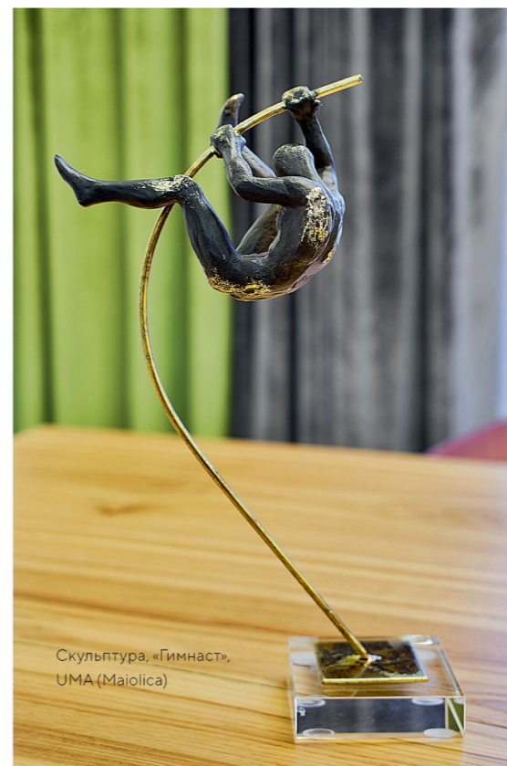
Скульптура, «Гимнаст», UMA (Maiolica)