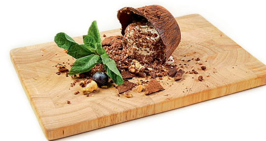
Десерт: мороженое с имбирем и мятой, в шоколадной корзине и крошке из пряника